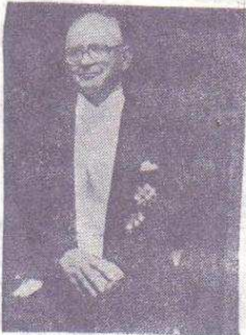
PREZYDENT RP. KAZIMIERZ SABBAT

Każda działalność publiczna oprócz podłoża ideowego musi mieć formę oraz strukturę organizacyjną. Walka o wolność i niepodległość naszego, zniewolonego przez przemoc sowiecką, narodu musi być prowadzona na obczyźnie przez polityczną emigrację niepodległościową. Naród w Kraju nie ma możliwości oficjalnego wypowiedzenia swych pragnień i dążeń. Tę rolę musiała przejąć emigracja i będzie ją kontynuowała aż do zwycięskiego końca, to jest ozykania wolności i niepodległości. Polska emigracja niepodległościowa jest jedyną w świecie, która w oparciu o konstytucję swojego własnego kraju / Ustawa Konstytucyjna z dnia 23 kwietnia 1935r. / powołuje się na legalizm, to jest ciągłość władz i organów suwerennego państwa polskiego z Prezydentem Rzeczypospolitej Polskiej na